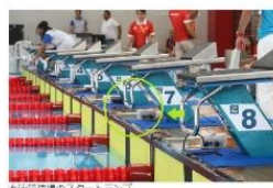
水泳競技用のスタートランプ

障害のある人ない人がともにスポーツを実施する環境整備と障害のある人が身近な環境でスポーツを実施するためのアクセス改善が必要である。地域の「障害者スポーツセンター」やより身近にあるスポーツ施設に障害者スポーツ用具を整備し、障害のある人が身近な地域で気軽に運動・スポーツに楽しめる環境を構築することを目的とする。