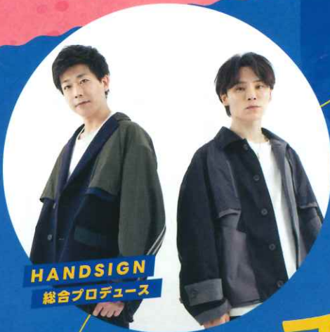
HANDSIGN 総合プロデュース